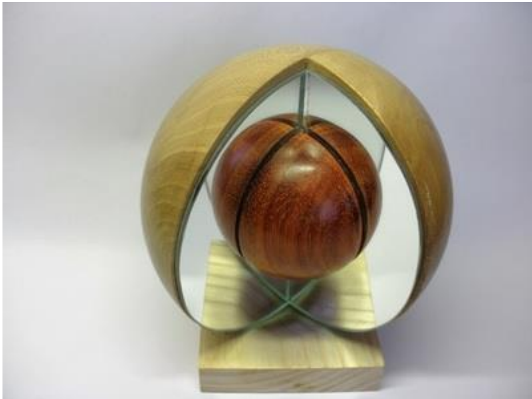
Nr 10 Mirror of fantasie