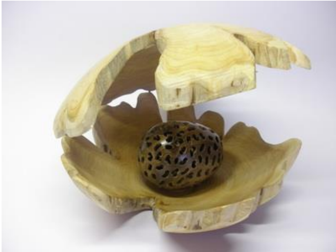
Nr 7 "Schuilen "