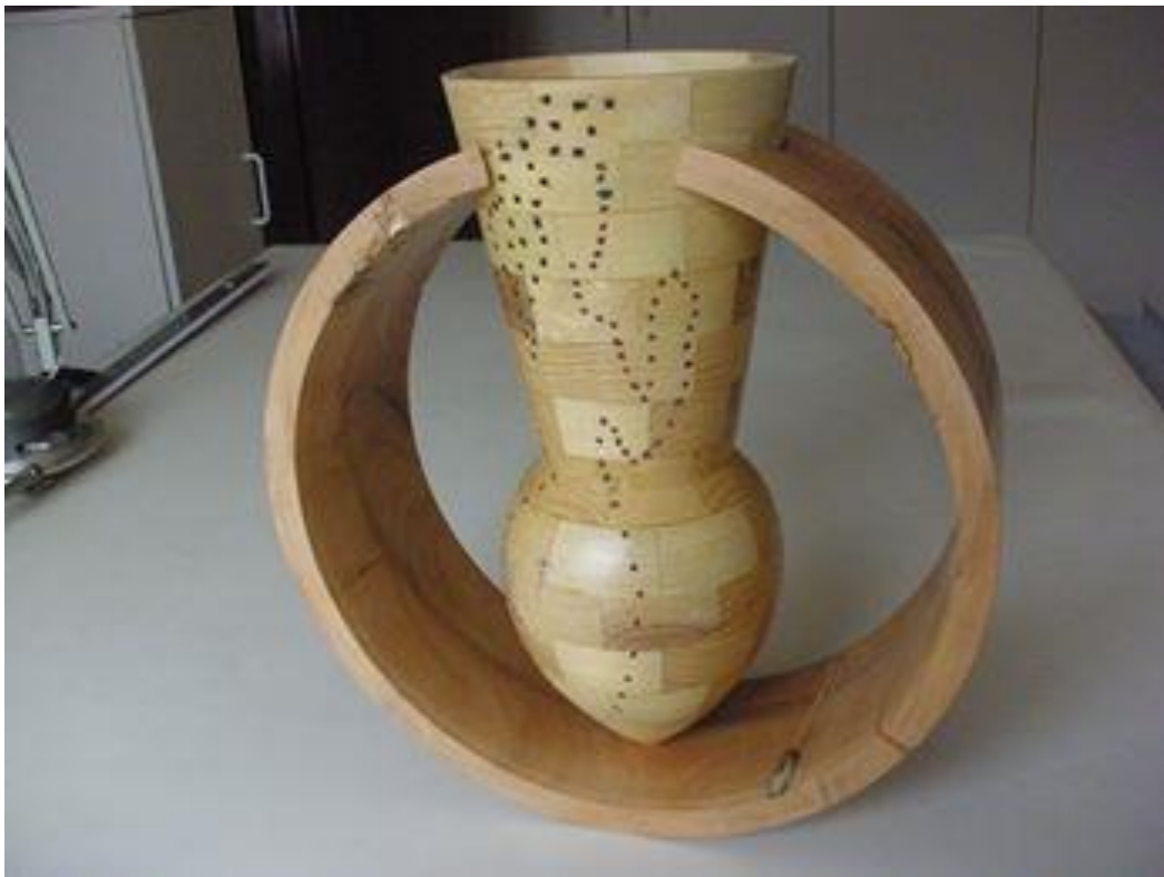
Nr 5 "Strong Women"