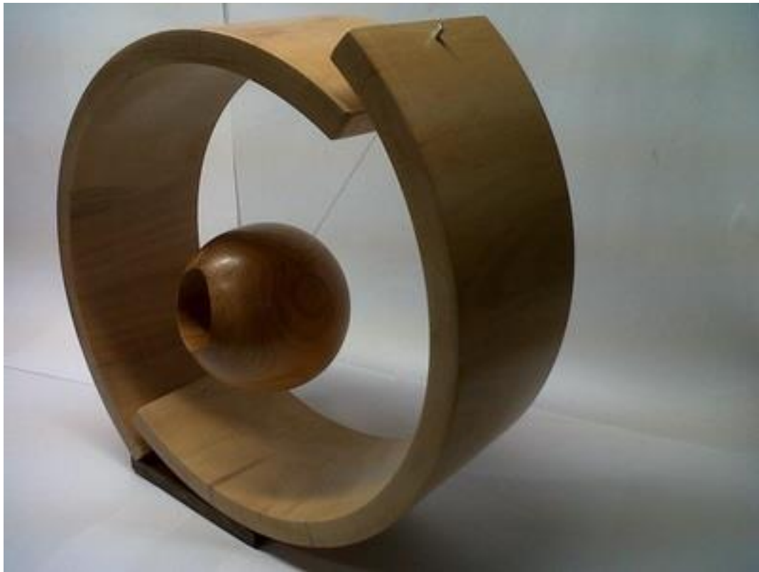
Nr 6 "Circle of life"