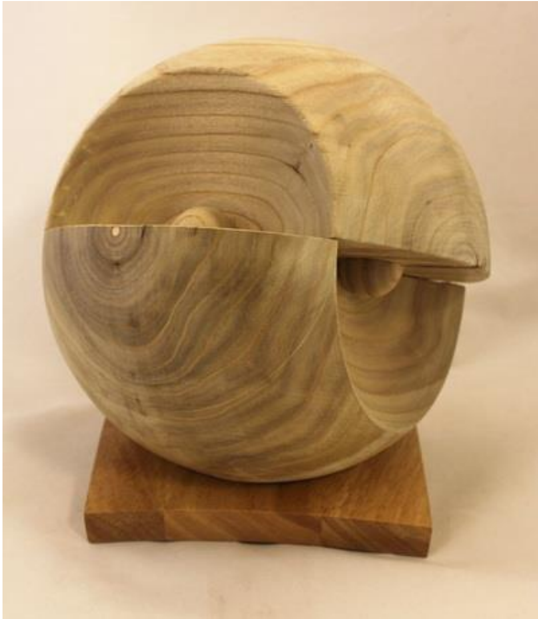
Nr 4 "Bolvorm in omkeertechniek" tulphout