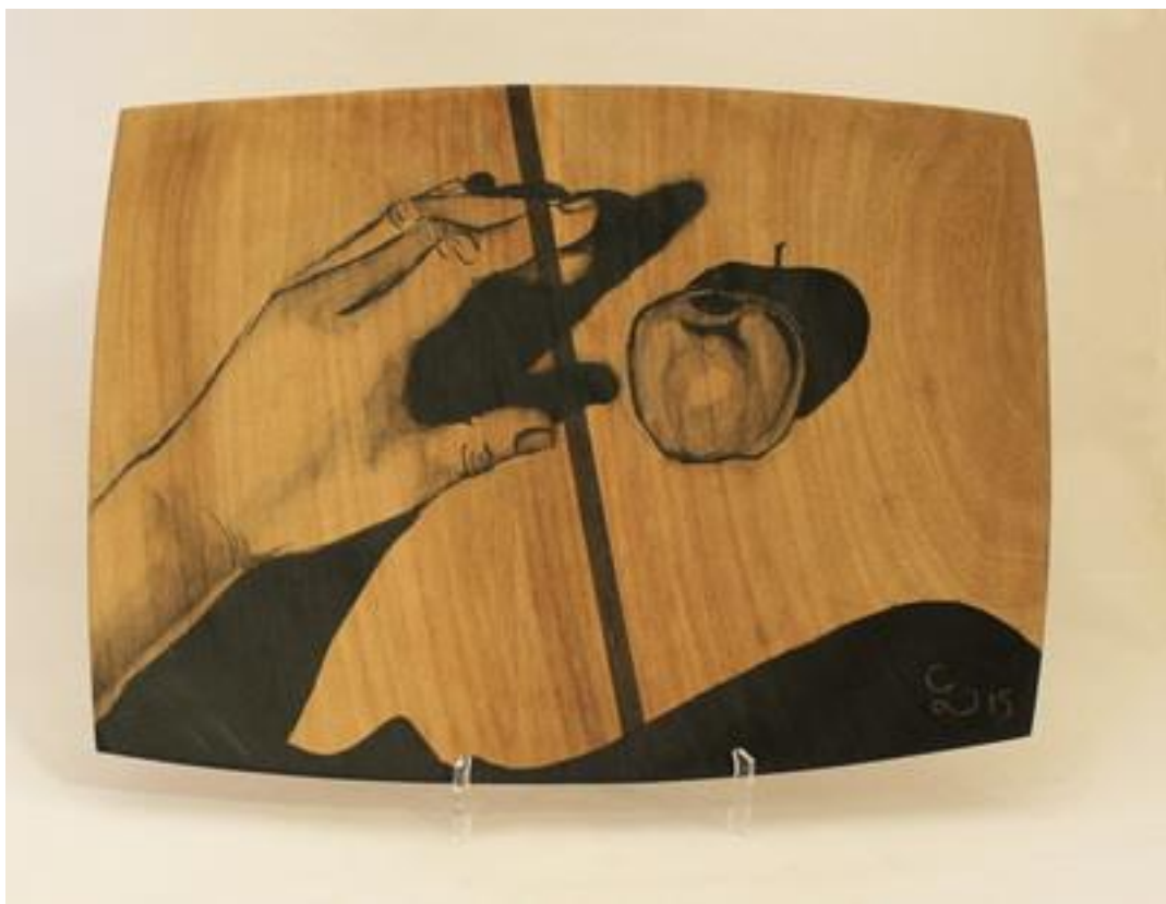
Samengesteld stuk van iep en wengé gedecoreerd door Camilia Dallali