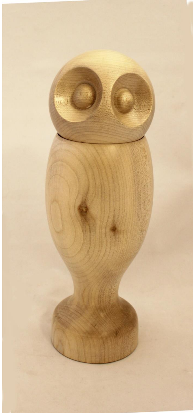
Nr 9 "Uil" Esdoorn