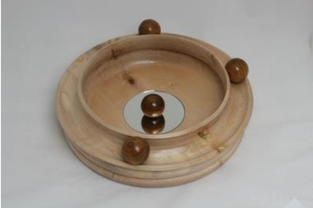
Nr 12 "Wat jezelf opbouwt kan jezelf veranderen"