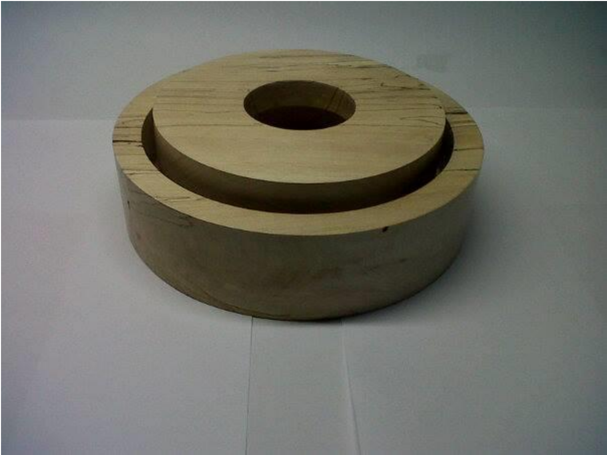
Nr 13 Simply